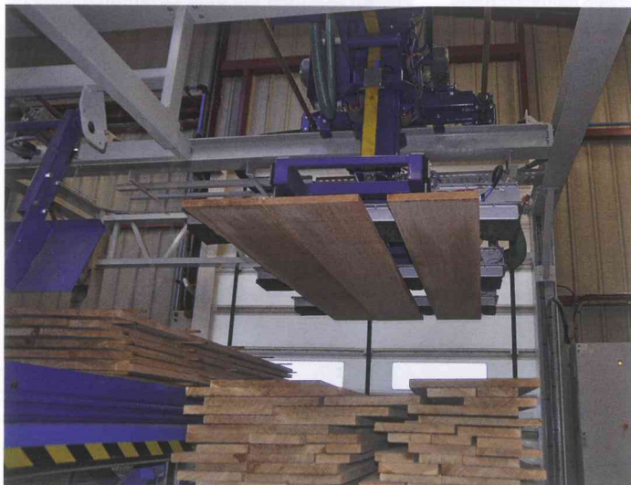
Präzise Stapelung mit Vakuumtechnik: Für die Abstapelung durch Joulin-Greifer sind alle Holzarten geeignet