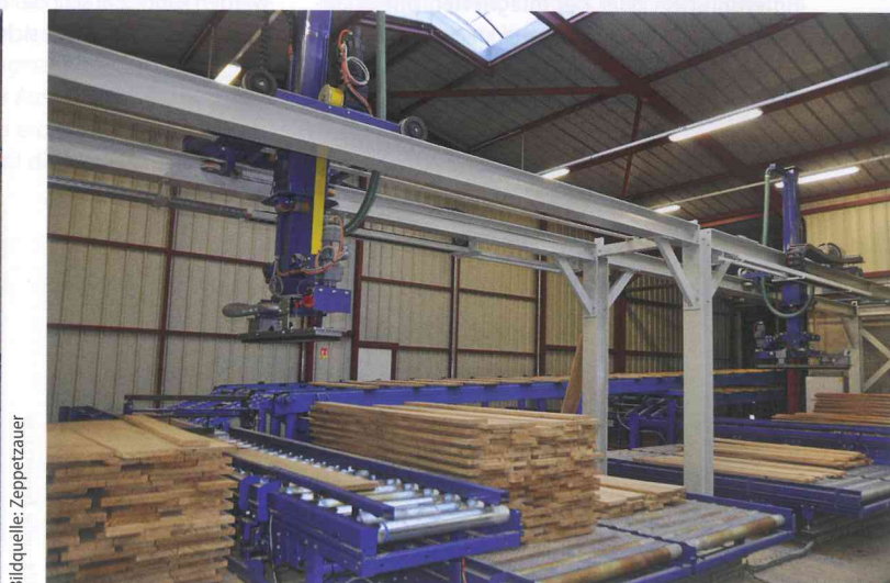
Kontinuierliche Abnahme: Die beiden Greifer nehmen abwechselnd die Bretter in der Sortierung auf